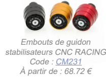
Embouts de guidon stabilisateurs CNC RACING Code : CM231 À partir de : 68.72 €