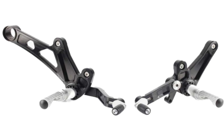
Commandes reculées CNC RACING Code : PE222 À partir de : 619.79€

Cette fiche présente un certain nombre d'accessoires disponibles pour les DIAVEL 1200, mais vous retrouverez tous les produits disponibles pour cette moto sur www.evo-xracing.com .