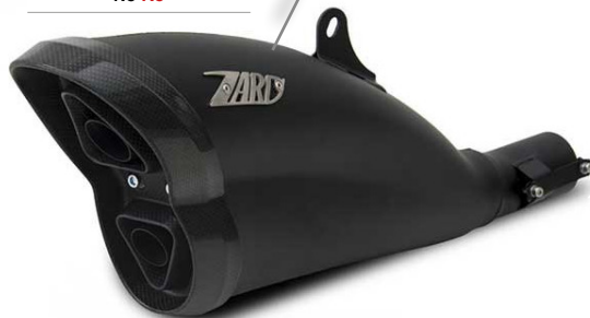
Kit échappement + raccord inox Ducati Diavel 1260 ZARD Homologué ou racing Embout carbone ou inox Code : ZDU117S10 À partir de : 1299.90 €