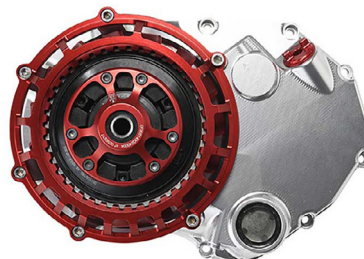
Kit embrayage à sec EVO-GP STM Code : KIT-0700 À partir de : 3 491.30€