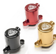
Récepteur embrayage CNC RACING Code : AF280 À partir de : 176.26€