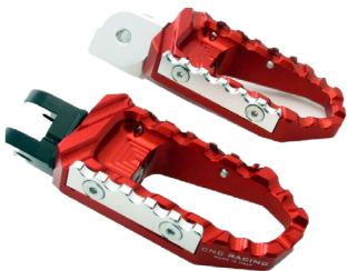
Repose-pieds alu taillé masse CNC RACING Code : PE216 À partir de : 236.68 €