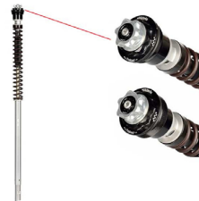
Kit cartouche complet MATRIS Code : F20D111K À partir de : 1119.60 €