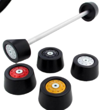
rampons de protection Code roue avant : TP425 Code roue arrière : TP424 À partir de : 96.08 €