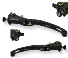
Levier de frein et d'embrayage repliable Pramac Limited édition CNC RACING Embrayage : LCR12PR Frein : LBR04PR À partir de : 182.40€ unité