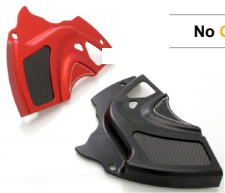
Cache pignon CNC RACING Code : CP151 À partir de : 142.87€