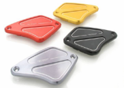
Paire couvercle réservoir maitre cylindre / embrayage CNC RACING Code : KT050 À partir de : 92.27 €