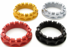
- Kit écrous axe de roue arrière CNC RACING Code : DA394 À partir de : 73.30 €